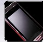
ガラス飛散防止 Anti-scattering film for glass