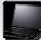
パソコン・カメラ等 画面保護 Display protection for PC, digital camera