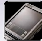
タッチパネル端末の アイコンシート・画面保護 Display protection for touch panel display